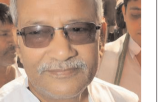
नरेंद्र नारायण आज करेंगे नामांकन दाखिल

पटना, 21 फरवरी (देशबन्धु)। बिहार विधानसभा के पूर्व उपाध्यक्ष महेश्वर हजारी के इस्तीफे के बाद जेडीयू कोटे से विधायक नरेंद्र नारायण यादव विधानसभा के उपाध्यक्ष होंगे। उपाध्यक्ष पद के लिए नरेंद्र नारायण यादव गुरुवार को अपना नामांकन दाखिल करेंगे। मुख्यमंत्री नीतीश कुमार से मुलाकात के बाद खुद उन्होंने इसकी जानकारी दी है। बताते चले कि बिहार विधानसभा के पूर्व उपाध्यक्ष महेश्वर हजारी ने उपाध्यक्ष पद से इस्तीफा देने को लेकर कहा कि उन्होंने आलाकमान के नॉलेज में देने के बाद पद से इस्तीफा दिया है। हम पार्टी के समर्पित सिपाही हैं और पार्टी आलाकमान का जो निर्देश होगा, हम वही काम करेंगे। जब उनसे पूछा गया कि उनको मंत्री बनाने की चर्चा है तो इस पर उन्होंने कहा कि यह सब फैसला आलाकमान को करना होता है। लोकसभा चुनाव लड़ने के सवाल पर हजारी ने कहा कि इस बारे में हमें कोई जानकारी नहीं है, पार्टी का जैसा निर्देश होगा हम वही करेंगे। आलाकमान के हर निर्देश का पालन होगा,