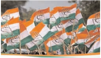
ग्वालियर-चंबल की दो सीटें जहां पैन्ल में पांच-पांच नाम

भोपाल, 21 फरवरी (एजेंसियां)। मध्य प्रदेश की राजनीति में कमलनाथ विवाद खत्म होने के बाद पार्टी अब लोकसभा चुनाव की तैयारियों में जुट गई है। पार्टी ने मध्य प्रदेश की 29 में से 26 सीटों पर नामों के पैन्ल तैयार कर लिए हैं। 6 सीटों पर एकल नाम तय किए गए हैं, जबकि 14 लोकसभा सीटों पर 2-2 नाम तय किए हैं। 4 सीटों पर 3-3 नाम शामिल किए हैं। ग्वालियर-चंबल की 2 सीटें ऐसी हैं, जहां पैन्ल में 5-5 नाम हैं। भोपाल, इंदौर और सतना सीट पर अभी तक नाम तय नहीं हो पाए हैं। प्रदेश कांग्रेस कमेटी की ओर से तैयार पैन्ल पर केंद्रीय चुनाव समिति की बैठक में चर्चा की जाएगी और फिर नाम फाइनल किए जाएंगे। खजुराहो सीट पर भी पैन्ल बनाया गया है, लेकिन यह सीट सपा के लिए छोड़ी जा सकती है।