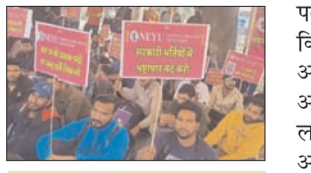
दोबारा परीक्षा आयोजित करने की मांग की

भोपाल, 28 फरवरी (एजेसिया)। मध्य प्रदेश में पटवारी भर्ती परीक्षा को रद्द करने की मांग तेज होती जा रही है। बुधवार को भोपाल में नेशनल एजुकेटेड यूथ यूनिजन के बैनर तले अभ्यार्थी परीक्षा रद्द करने की मांग को लेकर एकजुट हुए। एमपी नगर चौराहे पर एकजुट होने के बाद अभ्यार्थी वल्लभ भवन की तरफ बढ़े। पुलिस ने उनको व्यापम चौराहे के पास। बैरकिटिंग कर रोक लिया। इसके बावजूद आगे बढ़ने की बात पर अड़े कुछ अभ्यार्थियों को हिरासत में ले लिया। अभ्यार्थी पटवारी परीक्षा की नियुक्ति प्रक्रिया को तत्काल रद्द करने, परीक्षा की जांच रिपोर्ट को सार्वजनिक करने, मुख्य न्यायाधीश के नेतृत्व में तकनीकी विशेषज्ञों की कमेटी से जांच कराने, दोषियों को सख्त सजा दिलाने और दोबारा परीक्षा आयोजित करने की मांग कर रहे हैं। उनका कहना है कि