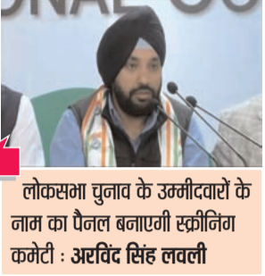
लोकसभा चुनाव के उम्मीदवारों के नाम का फैसला बनाएगी स्क्रीनिंग कमेटी : अरविंद सिंह लवली

नई दिल्ली, 28 फरवरी (देशबन्धु)। आगामी लोकसभा चुनाव के मद्देनजर जनता के बीच अपनी बात रखने के लिए दिल्ली कांग्रेस की ओर से चुनाव के लिए मेनिफेस्टो तैयार करने की तैयारी की जा रही है। इस बातबत बुधवार को दिल्ली प्रदेश कांग्रेस कमेटेी के कार्यालय पर कांग्रेस के पदाधिकारियों की बैठक हुई। इसमें निर्णय लिया गया कि प्रदेश कांग्रेस की मेनिफेस्टो कमेटेी जनता के बीच जाएगी और उनसे राय लेकर दिल्ली का न्याय संकल्प पत्र तैयार करेगी। लोकसभा चुनाव में 30 विषयों पर कांग्रेस केंद्र सरकार को घेरेगी। फिलहाल अभी तक दिल्ली की तीन सीटों पर लोकसभा चुनाव के लिए कांग्रेस की तरफ से प्रत्याशियों के नाम की घोषणा नहीं की गई है। कांग्रेस के दिल्ली प्रदेश अध्यक्ष अरविंद सिंह लवली का कहना है कि