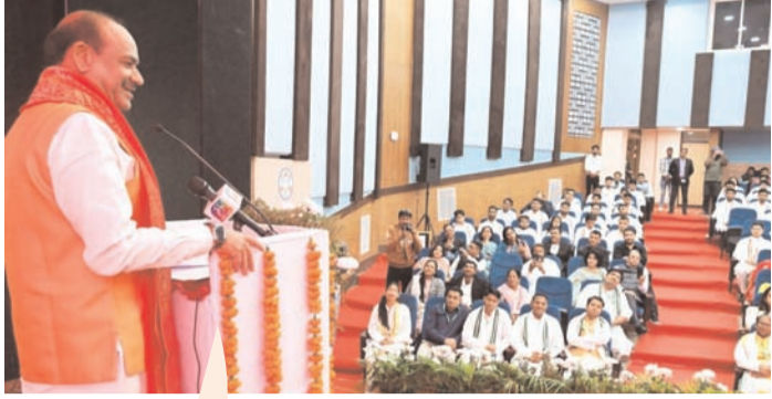
गुरुकुल पद्धति की हमारी प्राचीन विरासत ने ज्ञान प्राप्त व भाईचारे की भावना को बढ़ावा दिया : ओम बिरला

नई दिल्ली, 28 फरवरी (देशबन्धु)। लोकसभा अध्यक्ष ओम बिरला ने कोटा में भारतीय सूचना प्रौद्योगिकी संस्थान के तीसरे दीक्षांत समारोह को संबोधित किया और इस बात पर संतोष व्यक्त किया कि यह समारोह पहली बार कोटा परिसर में आयोजित किया जा रहा है, जो संस्थान की यात्रा में एक महत्वपूर्ण पड़ाव है। दीक्षांत कार्यक्रम में मुख्य अतिथि ओम बिरला ने स्नातक कोटा की उपाधि प्राप्त कर रहे छात्रों को उनकी उपलब्धियों के लिए बधाई देते हुए उन्हें उच्चतर शिक्षा और रोजगार के सपने देखने की प्रेरणा दी। उन्होंने आईआईआईटी, कोटा के छात्रों की औपचारिक शिक्षा के सफलतापूर्वक पूरा होने में इस संस्थान के प्रतिभाशाली, मेहनती और हौनदार छात्रों के प्रयासों और उनके माता-पिता और शिक्षकों के अपार योगदान की सराहना की। लोकसभा अध्यक्ष ओम बिरला ने प्राचीन भारत में गुरुकुलों और शिक्षा की समृद्ध संस्कृति का उल्लेख किया जिसमें विद्यार्थियों को न केवल शिक्षा बल्कि जीवन कोशल भी प्रदान किया जाता था, जिससे जीवन के सभी क्षेत्रों में उनका समग्र विकास होता था। उन्होंने कहा कि छात्रों में नई सोच को प्रोत्साहित और विकसित किया जाना चाहिए, जिसके परिणामस्वरूप वे नवाचार को अपनाएँगे,