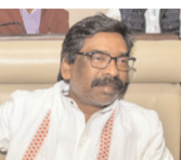
जमीन घोटाले में 31 जनवरी से न्यायिक हिरासत में हैं हेमंत सोरेन

रांची, 28 फरवरी (एजेसिया)। झारखंड हाईकोर्ट ने विधानसभा के बजट सत्र की कार्यवाही में भाग लेने की इजाजत से संबंधित हेमंत सोरेन की याचिका खारिज कर दी है। हेमंत सोरेन जमीन घोटाले में 31 जनवरी से न्यायिक हिरासत में जेल में हैं। वह विधानसभा में बरहट निर्वाचन क्षेत्र का प्रतिनिधित्व करते हैं। सोरेन ने 20 फरवरी को पीएमएलएल कोर्ट में अर्जी दायर कर विधानसभा के बजट सत्र में शामिल होने की इजाजत मांगी थी। 21 फरवरी को सुनवाई के बाद कोर्ट ने उनकी अर्जी खारिज कर दी थी। इसके बाद उन्होंने पीएमएलएल कोर्ट के फैसले के खिलाफ हाईकोर्ट में याचिका दायर की। जिस्टिस सुजीत नारायण प्रसाद की कोर्ट ने 26 फरवरी को सुनवाई के बाद फैसला सुरक्षित रखा था। याचिका पर सुनवाई के दौरान