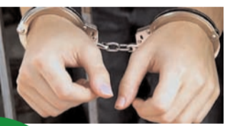
पीडित महिला के बयान के बाद हाजरा को किया गिरफ्तार

कोलकाता, 18 फरवरी (एजेंसियां)। पश्चिम बंगाल के उत्तर 24 परगना जिले की एक स्थानीय अदालत ने संकेतप्रस्त संदेशखाली में कथित सामूहिक यौन उत्पीड़न और आदिवासी लोगों की जमीनें