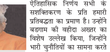
उपराज्यपाल ने आवाम की आवाज कार्यक्रम को किया संबोधित