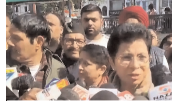
■ उत्तराखंड दौरे पर पहुंची प्रदेश प्रभारी कुमारी शैलजा

देहरादून, 19 फरवरी (एजेंसियां)। उत्तराखंड कांग्रेस ने लोकसभा चुनाव की तैयारियों को तेज कर दिया है। कुमारी शैलजा के उत्तराखंड कांग्रेस प्रभारी बनने और उत्तराखंड में कांग्रेस पदाधिकारियों के साथ बैठक करने के बाद न सिर्फ कांग्रेस में हलचल बढ़ी है बल्कि चुनावी रणनीतियों पर काम भी शुरू हो गया है। हालांकि, वो बात अलग है कि पिछले कुछ समय में कोटद्वार और देहरादून में कांग्रेस के पूर्व नेताओं ने पार्टी का दामन छोड़ा हो लेकिन वर्तमान समय में कांग्रेस अपनी स्थितियों को मजबूत करने के साथ ही पांचों लोकसभा सीटों के लिए मजबूत प्रत्याशियों के चयन पर विशेष जोर दे रही है।