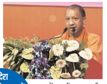
■ प्रधानमंत्री मोदी के तीसरे कार्यकाल में भारत दुनिया की तीसरी अर्थव्यवस्था बनेगा, इसमें किसी को कोई संदेह नहीं। यह मोदी की गारंटी है, इस पर यूपी को भी यकीन है।

लखनऊ , 19 फरवरी (देशबन्धु)। मुख्यमंत्री योगी आदित्यनाथ ने सोमवार को चौथी ग्रांड ब्रेकिंग सेरेमनी के शुभारंभ के लिए प्रदेश आगमन पर प्रधानमंत्री नरेन्द्र मोदी का आभार जताया और 10 लाख करोड़ से अधिक की परियोजनाओं को धरातल पर उतारने के लिए इंदिरा गांधी प्रतिष्ठान में आए हुए निवेशकों व उद्यमियों का भी स्वागत किया। इस अवसर पर सीएम योगी ने कहा कि आज यूपी अपनी प्रतिभा और अनलिमिटेड पोटेंशियल को पहचान कर सुरक्षा, सुशासन और विकास से जुड़ चुका है। मुख्यमंत्री योगी ने कहा कि यह भूमि भगवान श्रीराम की है, गोपेश्वर श्रीकृष्ण की है, बाबा विश्वनाथ की है, ऋषि मुनिओं की कृपा भूमि है, मां गंगा, यमुना और सरयू जैसी नदियों का आशीर्वाद भी इसको प्राप्त हुआ है, यह धन्य भूमि है, पुण्य भूमि है, यह उद्यम और उद्यमता की भूमि है। आज उत्तर प्रदेश भारत के श्रम शक्ति पुंज को एक अर्थशक्ति पुंज के रूप में बनाने की ओर अग्रसर हुआ है। मुख्यमंत्री ने कहा कि पिछले 10 वर्ष में हमारा देश 11वीं अर्थव्यवस्था से 5वीं अर्थव्यवस्था के