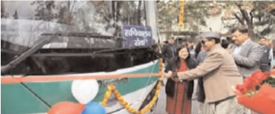
■ सीएस राधा रतूड़ी ने दिखाई हरी झंडी

देहरादून, 19 फरवरी (एजेंसियां)। उत्तराखंड की मुख्य सचिव राधा रतूड़ी ने सचिवालय कार्मिकों के लिए सचिवालय कॉलोनी केदारपुरम से सचिवालय तक इलेक्ट्रिक बस सेवा का उद्घाटन किया। यह बस सेवा शुरू होने के बाद अब सचिवालय कर्मी आसानी से आ जा सकेंगे। उन्हें आवाजाही में कोई परेशानी नहीं होगी। दरअसल, उत्तराखंड सचिवालय कार्मिकों के लिए इलेक्ट्रिक बस सेवा शुरू कर दी गई है। जिसका शुभारंभ मुख्य सचिव राधा रतूड़ी ने हरी झंडी दिखाकर किया। यह बस सेवा सचिवालय कॉलोनी केदारपुरम से सचिवालय तक चलेगी। जिसके जरिए सचिवालय कार्मिक आराम से आ जा सकेंगे। यह बस सेवा रोजाना सुबह कार्यालय समय में सचिवालय कॉलोनी केदारपुरम से सुभाष रोड सचिवालय तक चलेगी। जबकि, शाम को सचिवालय से सचिवालय कॉलोनी केदारपुरम तक सचिवालय कार्मिकों को पहुंचाने का काम करेगी। यह ग्रीन एनर्जी और पर्यावरण को ध्यान में रखकर शुरू की गई खास पहल है। बता दें कि देहरादून में स्मार्ट सिटी परियोजना के तहत इलेक्ट्रिक बसें