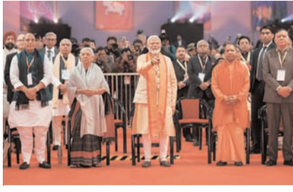
■ ग्रांड ब्रेकिंग सेरेमनी के चौथे संस्करण के उद्घाटन समारोह को किया संबोधित

आपने कभी सोचा नहीं होगा उतनी तेजी से यूपी अपने सारे संकल्पों को पूरा कर रहा है। ये बातें प्रधानमंत्री नरेन्द्र मोदी ने सोमवार को इंदिरा गांधी प्रतिष्ठान में आयोजित ग्रांड ब्रेकिंग सेरेमनी के चौथे संस्करण के उद्घाटन समारोह के दौरान कही। प्रधानमंत्री ने रिमोट का बटन दबाकर 10 लाख करोड़ रुपए से अधिक की 14 हजार से ज्यादा परियोजनाओं का शुभारंभ किया। इस दौरान उन्होंने चलचित्र के माध्यम से बदलते उत्तर प्रदेश की झलक भी देखीं। अपने उद्घोषण में प्रधानमंत्री ने कहा कि सात वर्ष पहले हम सोच भी नहीं सकते थे कि यूपी में निवेश और नौकरियों को लेकर ऐसा माहौल बनेगा। पहले चारों तरफ अपराध, दंगे, छीनाछपटी यही खबरें आती रहती थीं। उस दौरान अगर कोई कहता कि यूपी को विकसित बनाएंगे तो शायद कोई सुनने को भी तैयार नहीं होता। आज लाखों करोड़ का निवेश उत्तर प्रदेश में उतर रहा है। प्रधानमंत्री ने कहा कि आज उत्तर प्रदेश में हजारों