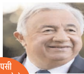
आपसी समझ बढ़ाने के तरीकों पर चर्चा होगी

नई दिल्ली, 19 फरवरी (एजेंसियां)। फ्रांसीसी सीनेट के अध्यक्ष जेराई लार्चर, पांच अन्य सीनेटर के प्रतिनिधिमंडल के साथ द्विपक्षीय संबंधों और संसदीय सहयोग को बढ़ाने के लिए दो दिवसीय आधिकारिक यात्रा पर यहां आए हुए हैं। यह उनकी भारत में पहली आधिकारिक यात्रा है। फ्रांसीसी दूतावास ने सोमवार को बताया कि श्री लार्चर और उनका प्रतिनिधिमंडल 19 और 20 फरवरी को अपनी यात्रा के दौरान उपराष्ट्रपति जगदीप धनखड़ से मुलाकात करेगा। फ्रांसीसी सीनेट और भारत की संसद के बीच एक समर्पित समझौते सहित सहयोग और आपसी समझ बढ़ाने के तरीकों पर चर्चा होगी।