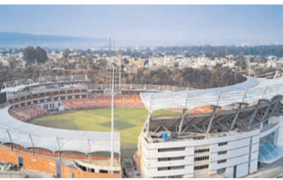
■ राष्ट्रीय खेलों के लिए होगा इस्तेमाल

देहरादून, 19 फरवरी (एजेंसियां)। रायपुर में स्थित राजीव गांधी अंतरराष्ट्रीय क्रिकेट स्टेडियम को विभाग ने अपने कब्जे में ले लिया है। खेल मंत्री ने कहा कि राज्य के लिए यह बड़ी सौगत है। जानकारी देते हुए बताया कि पूर्व में स्टेडियम को निविदा के आधार पर मेर्सस आईटीयूएल को दिया गया था जिसके लिए उन्होंने देहरादून इन्टीग्रेटेड अरीना लिमिटेड कंपनी को निर्मित कर राज्य सरकार के साथ मई, 2018 में अनुसंधान एवं संचालन के लिए अनुबन्धन किया गया था। जब कोरोना काल आया तो कंपनी ने स्टेडियम के संचालन के लिए प्रयास वित्तीय संसाधन के अभाव में इन्सोल्वेन्सी के लिए एनसीएलटी में वाद दायर किया था।