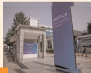
एचसीएलटेक दुनिया के प्रमुख व्यवसायों को सर्विसनाउ की विशेषज्ञता का खजाना प्रदान करता है : बिल नैकडरमॉट