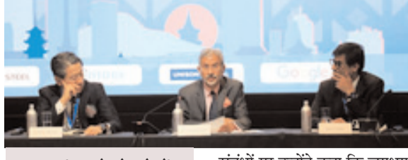
■ जयशंकर ने टोक्यो में पहले रायसीना गोलेमज सम्मेलन में लिया भाग

टोक्यो, 7 मार्च (एजेंसियाँ)। विदेश मंत्री एस जयशंकर ने गुरुवार को चीन का जिक्र करते हुए कहा कि यह चिंता का विषय है कि कोई देश पड़ोसी के साथ लिखित समझौतों का पालन नहीं करता।