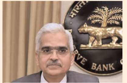
शक्तिकांत दास व पेरी वारजियो ने किए एमओयू पर हस्ताक्षर

मुंबई, 7 मार्च (एजेंसिया)। भारतीय रिजर्व बैंक (आरबीआई) और बैंक इंडोनेशिया (बीआई) ने दोनों देशों के बीच लेनदेन में स्थानीय मुद्राओं-भारतीय रुपया (आईएनआर) और इंडोनेशियाई रुपिया (आईडीआर) के उपयोग को बढ़ावा देने और एक रूपरेखा स्थापित करने के लिए गुरुवार को एक समझौता ज्ञापन (एमओयू) पर हस्ताक्षर किए। यहाँ आरबीआई गवर्नर शक्तिकांत दास और बैंक इंडोनेशिया के गवर्नर पेरी वारजियो ने एमओयू पर हस्ताक्षर किए। भारत और इंडोनेशिया के बीच स्थानीय मुद्राओं में सीमा पार लेनदेन के क्षेत्र में सहयोग के लिए एक रूपरेखा स्थापित करने पर समझौता ज्ञापन का उद्देश्य द्विपक्षीय रूप से आईएनआर और आईडीआर के उपयोग को बढ़ावा देना है।