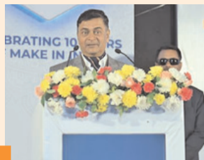
पिछले 10 वर्षों में सरकार ने 190 गीगावॉट बिजली उत्पादन क्षमता जोड़ी है : आरके सिंह

नई दिल्ली, 7 मार्च (एजेंसिया)। केंद्र सरकार ने पिछले 9 वर्षों में ऊर्जा क्षेत्र में लगभग 20 लाख करोड़ रुपए का निवेश किया है और अगले 5 से 7 वर्षों में 17 लाख करोड़ रुपए का निवेश करेगी। ये बात केंद्रीय ऊर्जा और नवीन एवं अक्षय ऊर्जा मंत्री आर.के. सिंह ने गुरुवार को कहा। एक कार्यक्रम में मंत्री ने कहा कि ऊर्जा क्षेत्र की तेज वृद्धि से मांग पैदा हो रही है और सरकार चाहती है कि इस मांग को मेड इन इंडिया से ही पूरा किया जाए। ऊर्जा मंत्री आर.के. सिंह ने कहा कि हमने पहले से ही नीति लागू कर दी है, जैसे कि सोलर मॉड्यूल पर 40 प्रतिशत की टैरिफ, ताकि उद्योग सुरक्षित रहे।