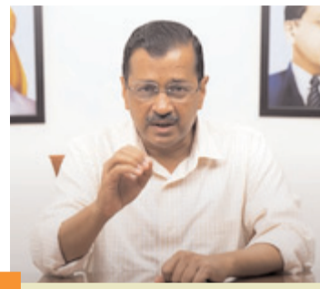
निगम सभी रेहड़ी पटरी वालों का सर्वे कराएगा व दुकान लगाने के लिए अच्छी व्यवस्था की जाएगी : केजरीवाल

नई दिल्ली, 16 मार्च (देशबन्धु)। दिल्ली नगर निगम की आप सरकार ने रेहड़ी पटरी वालों को इज्जत के साथ अपना काम करने के लिए बड़ा फैसला किया है। एमसीडी अब इनका सर्वे कराएगी और दुकान लगाने के लिए जगह देगी। आम आदमी पार्टी के राष्ट्रीय संयोजक एवं सीएम अरविंद केजरीवाल ने दिल्लीवालों को यह खुशखबरी देते हुए बताया कि पूरी दिल्ली में सभी रेहड़ी-पटरी पर दुकान लगाने वालों का सर्वे कराया जाएगा और उनको दुकान लगाने के लिए अच्छी व्यवस्था की जाएगी। ये लोग भी हमारे भाई-बहन हैं और उनको अच्छी व्यवस्था देना हमारी जिम्मेदारी है, ताकि वो लोग भी इज्जत के साथ अपना काम कर सकें। इस सर्वे के बाद ये लोग बिना किसी परेशानी के अपनी दुकान लगा सकेंगे। इसके बाद पुलिस, कमेट्री या अफसर उनको परेशान नहीं कर सकेंगे।