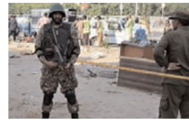
हमलावर सभी छह आतंकीवादियों को मार गिराया

रावलपिंडी , 16 मार्च (एजेंसियां)। पाकिस्तान के उत्तरी वजीरिस्तान जिले के अली इलाके में शनिवार को आतंकीयों ने हमला किया। इस हमले में दो अधिकारियों समेत सात पाकिस्तानी सैनिक मारे गए। डॉन की रिपोर्ट के अनुसार, पाकिस्तानी सेना के आईएसपीआर ने शनिवार को कहा कि छह आतंकीवादियों के एक समूह ने उत्तरी वजीरिस्तान जिले के मीर अली क्षेत्र में सुरक्षा बलों की चौकी पर हमला किया। हालांकि, सभी छह आतंकीवादियों को मार गिराया गया है।