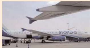
फरवरी में विमान सेवा कंपनियों के खिलाफ मिली 791 शिकायतें

नियामक की वेबसाइट पर जारी आंकड़ों के अनुसार, फरवरी में घरेलू हवाई यात्रियों की संख्या 126.48 लाख रही जो पिछले साल फरवरी में 120.69 लाख थी। इस प्रकार इसमें 4.80 फीसदी की वृद्धि हुई है। फरवरी में विमान सेवा कंपनियों के खिलाफ 791 शिकायतें मिलीं।