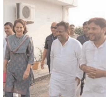
कार्यकर्ताओं का बड़ेगा मनोबल मतदाताओं पर पकड़ और होगी मजबूत

गाँतलब है कि रायबरेली संसदीय क्षेत्र से राहुल गांधी ने अपनी मां सोनिया