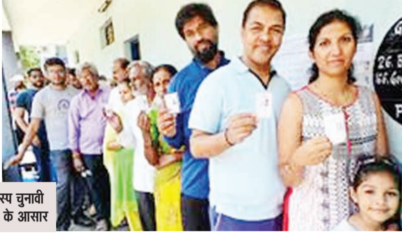
दिलचस्प चुनावी लड़ाई के आसार

इस चरण में 19 प्रत्याशी निर्दलीय हैं। इस चरण में सर्वाधिक 15 उम्मीदवार सुपौल और सबसे कम मधेपुरा में आठ प्रत्याशी मैदान में हैं।