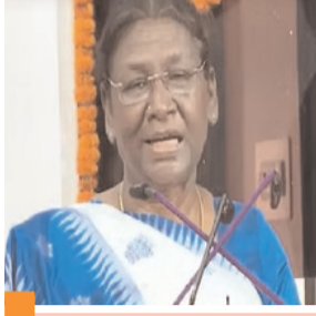
परिवर्तन प्रकृति का नियम है लेकिन अब इसकी गति बहुत तेज : द्रौपदी मुर्मु

की चुनौतियों से निपटने में सक्षम बनाना होगा। मुर्मु ने धर्मशाला में हिमाचल प्रदेश केन्द्रीय विश्वविद्यालय के 7 वें दीक्षांत समारोह को संबोधित करते हुए कहा कि परिवर्तन प्रकृति का नियम है लेकिन अब इसकी गति बहुत तेज है। इस अवसर पर राज्यपाल शिव प्रताप शुक्ल ने हिमाचल आगमन पर राष्ट्रपति का स्वागत किया। उन्होंने डिग्री प्राप्त करने वाले मेधावियों को शुभकामनाएं देते हुए कहा कि दीक्षांत समारोह एक यादगार पल होता है जो विद्यार्थियों को भविष्य में प्रगति के पथ पर अग्रसर रहने की प्रेरणा देता है और अपने संस्थान के अविस्मरणीय क्षणों की याद दिलाता है। उन्होंने कहा कि यह क्षण रचनात्मकता, ज्ञान और निरंतर