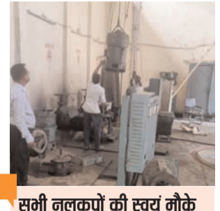
सभी नलकूपों की स्वयं मौके पर जाकर जांच करें