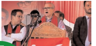
अब शांत इलाकों में भी हो रहे हमले

जम्मू-कश्मीर, 6 मई (एजेंसियां)। नेशनल कॉन्फ्रेंस के उपाध्यक्ष उमर अब्दुल्ला ने कहा कि जम्मू-कश्मीर में अभी आतंकवाद खत्म नहीं हुआ है। पिछले चार सालों में आतंकी हमले शांत इलाकों में भी हो रहे हैं। उमर ने कहा कि श्रीनगर, राजौरी और पुंछ के इलाके में लगातार आतंकी हमले हो रहे हैं। वहीं, एक सवाल के जवाब में अब्दुल्ला ने भारत और पाकिस्तान के बीच बातचीत की उम्मीद जताई। उन्होंने कहा कि अद्वैत बिहारी वाजपेयी ने कहा दोस्त बदले जा सकते हैं, लेकिन पड़ोसी नहीं बदले जा सकते हैं। पाकिस्तान में नई सरकार बन रही है। जून में देश में सरकार बनेगी। उम्मीद करते हैं कि दोनों नई सरकारें बातचीत का राह अपनाएंगी।