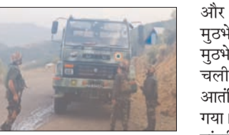
फिलहाल दूर की कौड़ी लग रहा दोनों जिलों में आतंकियों का सफाया

सुरेश एस डुगर जम्मू, 6 मई (देशबन्धु)। एलओसी से सटे जुड़वा जिले राजौरी व पुंछ सेना और अन्य सुरक्षाबलों के लिए फिलहाल सिर दर्द बने हुए हैं। हालात यह है कि पाकिस्तान द्वारा अपने पूर्व सैनिकों को आतंकी बना इन जिलों में धकेलने के कारण पिछले साल वे सुखियों में तो रहे ही।