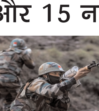
की शांति के उपरांत आतंकियों ने राजौरी के दरहाल में सैनिकों पर हमला बोला तो पांच जवान शहीद हो गए। हालांकि सेना अभी तक इन हमलों में शामिल आतंकियों को न ही पकड़ पाई है और न मार

नागरिक आतंकवाद की ओर मुहने लगे हैं। पिछले साल 22 नवम्बर को और फिर 21 दिसम्बर को एक माह के अंतराल में आतंकियों ने 10 फौजियों को मौत के घाट उतार कर सभी को चॉकाया था। जबकि वर्ष 2023 के मई को आतंकियों ने राजौरी के दरहाल में जो हमला किया था उसके बाद 22 नवम्बर और 21 दिसम्बर शहदतें फिर से राजौरी के आतंकवाद के इतिहास में एक खूनी अध्याय जोड़ चुकी हैं। पिछले साल के ही मई महीने की 6 तारीख को करीब 10 महीनों