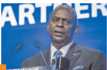
भारत के साथ लड़ाकू विमानों के जेट इंजन व बख्तरबंद वाहनों के सह-निर्माण में हमने ऐतिहासिक प्रगति की है : लॉयड ऑस्टिन

नई दिल्ली, 1 जून (एजेंसियां)। अमेरिका की रक्षा मंत्री लॉयड ऑस्टिन ने शनिवार को भारत से साथ बढ़ते रक्षा संबंधों को रेखांकित किया और हिंद-प्राशांत क्षेत्र के देशों की कुछ साझा उपलब्धियों का जिक्र किया। सिंगापुर में शांति-ला वार्ता को संबोधित करते हुए ऑस्टिन ने कहा कि हिंद-प्राशांत क्षेत्र के समान विचारधारा वाले देशों ने अपने रिश्तों को मजबूत किया है और क्षेत्र के लोगों के लिए वास्तविक जीवन में परिणाम दिए हैं। ऑस्टिन ने जापान, फिलिपींस, दक्षिण कोरिया और ऑस्ट्रेलिया जैसे देशों के साथ रक्षा संबंधों का जिक्र किया। भारत के बारे में उन्होंने कहा कि भारत से साथ लड़ाकू विमानों के जेट इंजन और बख्तरबंद वाहनों के सह-निर्माण में हमने ऐतिहासिक प्रगति की है। हवाई इंजन प्रदान करने वाले ऐतिहासिक प्रगति की है। हवाई इंजन प्रदान करने वाले ऐतिहासिक प्रगति की है।