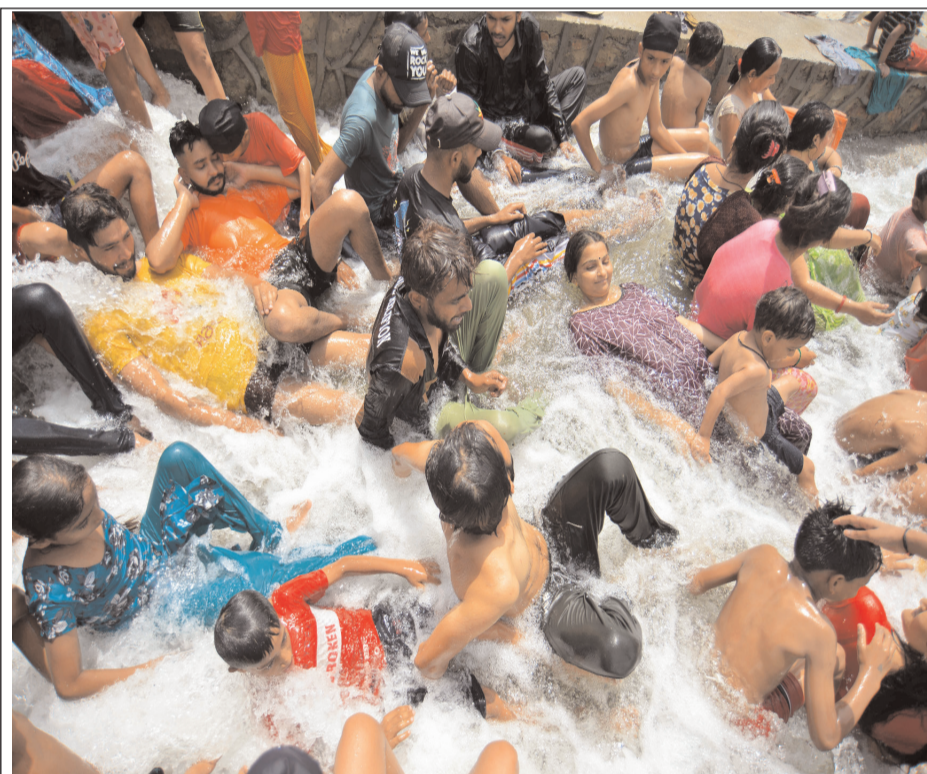
नई दिल्ली में भीषण गर्मी से राहत पाने के लिए बहते पानी में स्नान करते लोग।

हैं। उन्होंने भूमि के शहरीकरण और संबंधित राजस्व रिकॉर्ड की अनुपलब्धता का हवाला देते हुए अनुरोध अस्वीकार किया था। न्यायमूर्ति शर्मा ने कहा कि याचिकाकर्ता का जमीन पर कब्जा निस्संदेह अवैध था क्योंकि इस तथ्य से कि 30 साल या उससे ज्यादा समय तक किसी जमीन पर उन्होंने खेती की थी, उन्हें उस जमीन पर कानूनी अधिकार, स्वामित्व या उस पर कब्जा जारी रखने का कारण नहीं मिल जाता। अदालत ने इस बात को भी रेखांकित किया कि वहां लोगों की श्रद्धा होने या पूजा-प्रार्थना करने का कोई इतिहास नहीं है। अदालत ने उस स्थल पर बांया गिराने की धार्मिक मामलों की समिति की लंबित कार्य के तर्क को भी खारिज कर दिया। अदालत ने कहा कि वह एक निजी स्थल था और वहां आम लोगों की श्रद्धा जैसी बात नहीं थी।