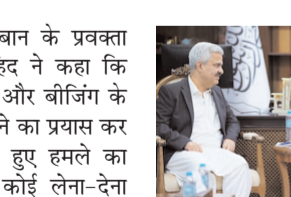
अफगान तालिबान के प्रवक्ता जबीउल्लाह मुजाहिद ने कहा कि पाकिस्तान काबुल और बीजिंग के बीच दरार पैदा करने का प्रयास कर रहा है। बेशाम में हुए हमले का अफगानिस्तान से कोई लेना-देना नहीं है। पाकिस्तान को अपनी सुरक्षा खुद सुनिश्चित करनी चाहिए। उन्होंने कहा कि चीन के नागरिकों को निशाना बनाना पाकिस्तान का मामला है। इसका अफगानिस्तान से कोई लेना-देना नहीं है। पाकिस्तान द्वारा प्रकाशित रिपोर्ट चीन और अफगानिस्तान के बीच अविश्वास पैदा करने की कोशिश है। हमने बार-बार इसका खंडन किया है। पाकिस्तान ने कहा था कि अफगान प्रशासन जांच को आगे बढ़ाने के लिए इस्लामाबाद के साथ सहयोग करने और काम करने के लिए तैयार है। पाक के इस बयान

इस्लामाबाद, 1 जून (एजेंसियां)। अफगानिस्तान के बेशाम शहर में चाइनीज इंजीनियरों को ले जा रही बस पर मार्च में आतंकी हमला हुआ था। तालिबान का कहना है कि उसका इस हमले से कोई संबंध नहीं है। साथ ही हमले की जांच में तालिबान ने पाकिस्तान की मदद से भी इनकार कर दिया है। काबुल ने कहा कि 26 मार्च को हुए आतंकी हमले से हमारा कोई संबंध नहीं है, जिसमें पांच चाइनीज इंजीनियर मारे गए थे। अफगान तालिबान ने बेशाम हमले की चल रही जांच में मदद के लिए इस्लामाबाद के अनुरोध को भी ठुकरा दिया है।