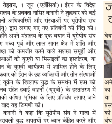
जर्मनी व ईयू ने बाइडेन की योजना का किया समर्थन