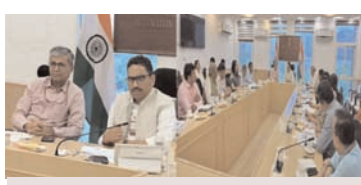
आयुष मंत्रालय ने तैयार किया एक 'योग गीत'

नई दिल्ली, 7 जून (एजेंसियां)। सूचना एवं प्रसारण मंत्रालय के सचिव संजय जाजू और आयुष मंत्रालय सचिव वैद्य राजेश कोटेचा ने शुक्रवार को अंतरराष्ट्रीय योग दिवस समारोह की तैयारियों की समीक्षा की। केंद्रीय आयुष मंत्रालय ने यहां बताया कि आगामी 21 जून को मनाए जाने वाले अंतरराष्ट्रीय योग दिवस 2024 के आयोजन की तैयारियां शुरू कर दी हैं।