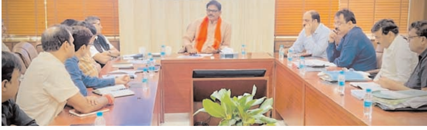
किसानों के मुद्दों को लेकर जेवर विधायक ने यमुना प्राधिकरण के अधिकारियों के साथ की बैठक

ग्रेटर नोएडा, 7 जून (देशबन्धु)। यमुना एक्सप्रेस वे प्राधिकरण के अधिसूचित क्षेत्र में आने वाले 107 पंचायत घरों का मरम्मत व रखरखाव करने का जिम्मा लिया है। जल्द ही इन गांवों में पंचायत घर नए रंग रूप में नजर आएगा। यमुना प्राधिकरण के अधिसूचित क्षेत्र में आने पर 107 गांवों में पंचायत घर कर सकेंगे, जहां पर युवाओं को तैयारी के लिए पुस्तकालय की व्यवस्था की जाएगी।