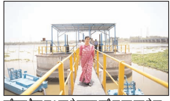
वजीराबाद बैराज पर 2 जून से लगातार पानी का स्तर कम हो रहा है। यह 2 जून को 671.3 फीट से घटकर मात्र 669.7 फीट रह गया है। आतिशी, जलमन्त्री, दिल्ली सरकार

पानी को लेकर 'आप' और बीजेपी के बीच जुबानी जंग हो रही है