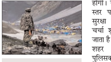
29 जून से दो माह तक चलेगी अमरनाथ यात्रा

हालांकि अमरनाथ यात्रा की समाप्ति के बाद विधानसभा चुनावों की तैयारियों आरंभ हो जाएंगी। प्रदेश में लोकसभा चुनाव को सफलतापूर्वक संपन्न करवाने के बाद भी स्टेट पुलिस राहत की सांस लेने की स्थिति में नहीं है। चुनाव संपन्न होने के बाद राज्य पुलिस के सामने अमरनाथ यात्रा की सुरक्षा चुनौती बनकर खड़ी है और उसके बाद विधानसभा चुनावों की। चुनाव संपन्न होने के साथ ही निचले स्तर के पुलिसकर्मियों ने राहत