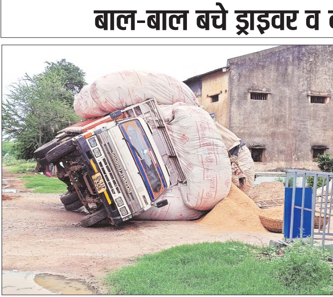
आए दिन होने वाले सड़क हादसों पर पुलिस प्रशासन मौन-बताया जा रहा है कि पाटन पुलिस यातायात व्यवस्था एवं बिना नम्बर और ओवर लोड वाहनों पर कार्यवाही करने से कतराती है पुलिस थाने के

पाटन देशबन्धु। पाटन थानांतर्गत आने वाले गुरुपेरिया गांव के समीप नायरा पेट्रोल पम्प के पास भूसे से भरी ओवर लोड डबल टायरी स्वराज माजदा के पलटने का सनसनी खेज मामला सामने आया है। प्राप्त जानकारी के अनुसार 12 जुलाई की दोपहर 2-3 बजे के आस पास स्वराज माजदा क्रमांक डीएल-01 एलपी 2358 जिसमें तय मात्रा से अधिक भूसा भरा था। चालक की लापरवाही के चलते गुरुपेरिया के समीप नायरा पेट्रोल पम्प के सामने समतल साईड पट्टी पर उल्टा वाहन पलट गया गनीमत रही घटना में कोई हताहत नहीं हुआ। ग्रामीणों ने बताया यदि यही हादसा नगर के नाका नम्बर दो से लेकर कृषि उपज मंडी के आस पास हुआ है तो कोई गंभीर घटना घटित हो सकती थी।