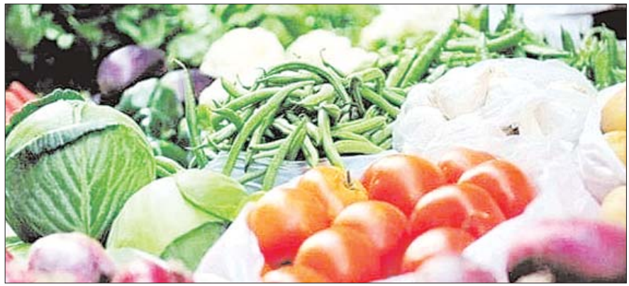
महंगाई दर 4.87 फीसदी रही थी। जून महीने में खाद्य महंगाई दर 9.36 फीसदी रही है जो मई में 8.83 फीसदी रही थी। जून 2023 में खाद्य महंगाई दर 4.31 फीसदी रही थी।

नई दिल्ली। खाद्य वस्तुओं की कीमतों में उछाल के चलते खुदरा महंगाई दर एक बार फिर 5 फीसदी के पार जा पहुंची है। जून 2024 में खुदरा महंगाई दर 5.08 फीसदी रही है जो मई 2024 में 4.80 फीसदी रही थी। खाद्य महंगाई दर में इजाफा देखने को मिला है और ये 9 फीसदी के पार चला गया है। जून में खाद्य महंगाई दर 9.36 फीसदी रही है जो मई में 8.83 फीसदी रही थी।