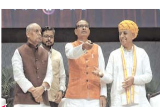
'एग्रीशोर फंड' सरकार द्वारा किए जा रहे पिछले प्रयासों की निरंतरता है : शिवराज सिंह चौहान

नई दिल्ली, 4 सितम्बर (एजेंसियां)। देश में ग्रामीण अर्थव्यवस्था को मजबूत करने के लिए सरकार की ओर से 'एग्रीशोर फंड' लॉन्च किया गया है। इस फंड का कैपिटल पूल 750 करोड़ रुपए का होगा और इससे कृषि क्षेत्र में निवेश को बढ़ावा मिलेगा। एग्रीशोर फंड को कृषि और ग्रामीण स्टार्टअप इकोसिस्टम में वृद्धि और इनोवेशन को बढ़ाने के लिए बनाया गया है। सरकार की ओर से दी गई जानकारी में बताया गया कि इस फंड का साइज 750 करोड़ रुपए का है। यह सेबी के पास कैटेगरी-2 के तहत पंजीकृत है। इस फंड को बनाने में सरकार ने 250 करोड़ रुपए, नाबार्ड ने 250 करोड़ रुपए और बैंकों एवं इश्योरस कंपनियों ने 250 करोड़ रुपए का योगदान दिया है।