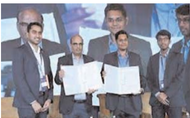
भारत में 30 लाख से अधिक छात्रों को 4.0 तकनीकों में सशक्त बनाने की तैयारी