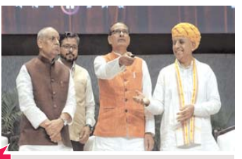
'एग्रीशोर फंड' सरकार द्वारा किए जा रहे पिछले प्रयासों की निरंतरता है : शिवराज सिंह चौहान

नई दिल्ली, 4 सितम्बर (एजेंसियां)। देश में ग्रामीण अर्थव्यवस्था को मजबूत करने के लिए सरकार की ओर से 'एग्रीशोर फंड' लॉन्च किया गया है। इस फंड का कैपिटल पूल 750 करोड़ रुपए का होगा और इससे कृषि क्षेत्र में निवेश को बढ़ावा मिलेगा।