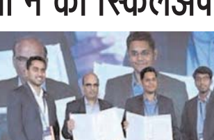
भारत में 30 लाख से अधिक छात्रों को 4.0 तकनीकों में सशक्त बनाने की तैयारी

नई दिल्ली, 4 सितम्बर (एजेंसियां)। नेक्स्टवेव ने राष्ट्रीय कौशल विकास निगम (एनएसडीसी) के साथ मिलकर नेक्स्टवेव स्किलअप इंडिया 4.0 का शुभारंभ किया है, जो भारत की एक अनूठी टेक अपस्किलिंग पहल है। कंपनी ने आज यहां जारी बयान में कहा कि नेक्स्टवेव स्किलअप इंडिया 4.0 देश का अनूठा अपस्किलिंग कार्यक्रम है, जिसे एआई, एमएल और फ्लू-स्टैक डेवलपमेंट जैसी 4.0 तकनीकों में उन्नत कौशल से लैस करके देश के युवाओं को सशक्त बनाने के लिए डिजाइन किया गया है। इस पहल का उद्देश्य उद्योग और शिक्षाविदों के बीच की दूरी को भरकर तकनीकी पेशेवरों और इन्वेंटेड्स को अगली पीढ़ी को बढ़ावा देना है। यह पहल पूरे भारत में 30 लाख से अधिक छात्रों को 4.0 तकनीकों में सशक्त बनाएगी और उन्हें सही करियर के अवसरों से जोड़ेगी। नेक्स्टवेव के प्रयास इन छात्रों को कुशल पेशेवरों में