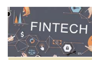
भारत की फिनटेक कंपनियों की अनुमानित संयुक्त वैल्यू 125 अरब डॉलर के करीब

नई दिल्ली, 4 सितम्बर (एजेंसियां)। भारत की फिनटेक इंडस्ट्री तेजी से आगे बढ़ रही है। मौजूदा समय में देश में 26 फिनटेक यूनिटें हैं। इनकी संयुक्त मार्केट वैल्यू 90 अरब डॉलर से भी ज्यादा है। एक रिपोर्ट में यह जानकारी दी गई। जेएम फाइनेंसियल की एक रिपोर्ट में बताया गया कि पिछले तीन वर्षों में भारत में फिनटेक स्टार्टअप की संख्या पांच गुना बढ़कर 10,200 (2024) हो गई है।