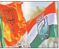
■ भाजपा-कांग्रेस घोषणा पत्र जारी करने में पीछे

यह सच है कि जम्मू-कश्मीर विधानसभा चुनाव के पहले चरण के मतदान की तिथि 18 सितंबर को है, लेकिन भारतीय जनता पार्टी (भाजपा) और कांग्रेस दोनों ने अभी तक अपना चुनावी घोषणा पत्र जारी नहीं किया है। जनता की राय जानने के बावजूद, दोनों में से किसी भी पार्टी ने मतदाताओं के सामने अपने लिखित वादे पेश नहीं किए हैं। नेशनल कॉंग्रेस (नेका), पीपुल्स डेमोक्रेटिक पार्टी (पीडीपी) और जम्मू-कश्मीर अपनी पार्टी जैसी क्षेत्रीय पार्टियों ने पहले ही अपने घोषणा पत्र