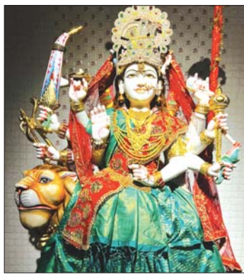
कल से प्रज्वलित होगा ज्योति कलश

मनोकामना मंदिर दुर्गा मंदिर धाम बनियागांव में वर्ष 2022 में मंदिर निर्माण होने के पश्चात् माँ भगवती के विग्रह का प्राण प्रतिष्ठा किया गया है। तब से मंदिर में भक्तों की संख्या निरंतर बढ़ रही है। देश के विभिन्न हिस्सों से भक्तों के द्वारा मनोकामना ज्योति कलश प्रज्वलित की जाती है। इस वर्ष भी प्रतिदिन रात्रि 8 बजे से रामलीला का कार्यक्रम रखा गया है।