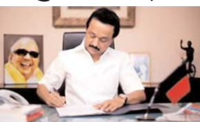
मुख्यमंत्री ने मोदी से तत्काल हस्तक्षेप का किया अनुरोध

मद्रुरै में टंगस्टन खनन की अनुमति रद्द करें केंद्र : स्टालिन