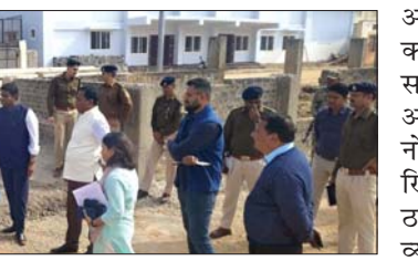
चर्चा करने के निर्देश दिए। बस्तर ओलंपिक के संभाग स्तरीय आयोजन में उद्घाटन और समापन समारोह की व्यवस्था, सुरक्षा व्यवस्था, परिवहन व्यवस्था, सांस्कृतिक कार्यक्रम की व्यवस्था, ब्रांडिंग की व्यवस्था सहित >>> शेष पृष्ठ 9 पर >>>