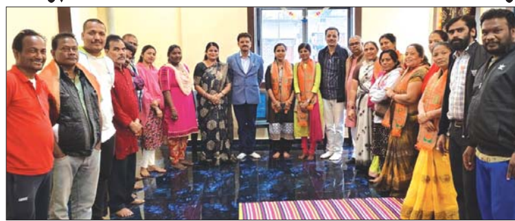
सबसे महत्वपूर्ण संगठन होता है। बुध के कार्यकर्ता ही भाजपा के आधार के रूप में वाई एवं बूथों में कार्य करते हैं और बुध भाजपा संगठन की सबसे मजबूत इकाई है। इसी को दृष्टिगत रखते हुए पार्टी अपने बूथों के गठन के साथ विस्तार के कार्य कर