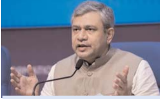
महाराष्ट्र में कुल 22 वंदे भारत सेवाएं मौजूद

केंद्रीय मंत्री वंदे भारत एक्सप्रेस शुरू करने के पीछे के औचित्य, सेवाओं-सुविधाएं और यात्री प्रतिक्रिया को लेकर के सवालों के जवाब में जानकारी दे रहे थे। दिल्ली-काठगोदाम सेक्टर को लेकर केंद्रीय मंत्री ने बताया कि दिल्ली-काठगोदाम सेक्टर में तीन जोड़ी एलएक्सप्रेस सेवाएं मौजूद हैं। इनमें 2039/40 काठगोदाम-नई दिल्ली शताब्दी एक्सप्रेस भी शामिल है। इसके अलावा, नई रेल सेवाओं, जिसमें वंदे भारत सर्विस भी शामिल है, की शुरुआत भारतीय रेलवे की निरंतर चलने वाली प्रक्रिया है।