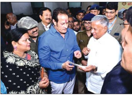
नई ट्रेन चलाने और स्टांपेज की मांग

पूर्व विधायक ने जनहित को मांगों को लेकर रेल राज्यमंत्री को ज्ञापन में लिखा है कि सराना रेलवे स्टेशन का विस्तार किया जाए। सराना रेलवे स्टेशन के नजदीक एम्स हॉस्पिटल है, इसलिए अम्बिकापुर दुर्ग एक्सप्रेस, सारनाथ और अमरकंटक एक्सप्रेस एवं इंटरसिटी का स्टांपेज घोषित किया जाए। नई ट्रेन के लिए रायपुर से नया रायपुर पटरी तैयार है, जिसे अमनपुर तक चलाया जाए। नया रायपुर में राज्य शासन से रेलवे को 18 एकड़ जमीन आर्बिट है। वहाँ पर ट्रेनों के मटेनेंस के लिए कोचिंग डिपो बनाया जाए। गरीब रथ का मटेनेंस स्टेशन के पीछे पर होता