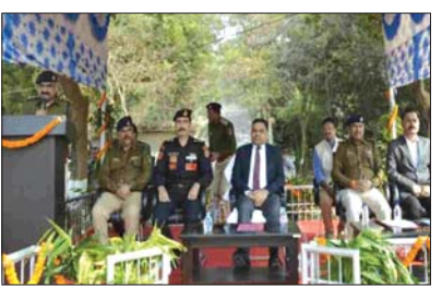
आपातकालीन परिस्थितियों से बचने के बता रहे तरीके