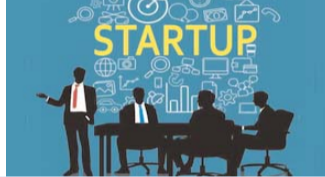
वैश्विक स्तर पर घोषित कुल वीसी सौदों में भारत की हिस्सेदारी 7.1 प्रतिशत रही

नई दिल्ली, 29 नवम्बर (एजेंसियां)। भारत में इस साल जनवरी-अक्टूबर तक की अवधि में लगभग 984 वेंचर कैपिटल (वीसी) फंडिंग सौदों की घोषणा की गई। शुक्रवार को आई रिपोर्ट के अनुसार, इस अवधि के दौरान इन सौदों का कुल घोषित फंडिंग मूल्य सालाना आधार पर 44.4 प्रतिशत बढ़कर 9.2 बिलियन डॉलर हो गया। डेटा और एनालिटिक्स कंपनी ग्लोबलवेटा की रिपोर्ट में डील वॉल्यूम में सालाना आधार पर 5.8 प्रतिशत का सुधार दिखाया गया है। रिपोर्ट में कहा गया है कि 2023 में इसी अवधि के दौरान भारत में कुल 930 वीसी सौदों की घोषणा की गई और इन सौदों का कुल घोषित फंडिंग मूल्य 6.4