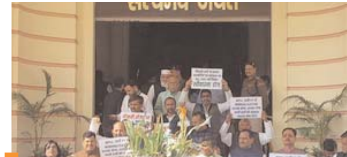
अगर यह सरकार बेरोजगार युवाओं को रोजगार देने की दिशा में असमर्थ है, तो फिर सरकार का क्या मतलब रह जाता है : राबड़ी देवी

इस दौरान राष्ट्रीय जनता दल (राजद) के विधायकों ने राबड़ी देवी की अगुवाई में विरोध प्रदर्शन किया। राबड़ी देवी ने पत्रकारों से कहा कि इस सरकार में बेरोजगार युवाओं को रोजगार नहीं मिला है। अगर यह सरकार बेरोजगार युवाओं को रोजगार देने की दिशा में पूरी तरह से असमर्थ है, तो फिर सरकार का क्या मतलब रह जाता है। उन्होंने आगे कहा कि जनता मतदान करके सरकार का चयन करती है, ताकि उनके हितों में कदम उठाने वाला कोई हो। लेकिन, ऐसा कोई भी कदम नहीं