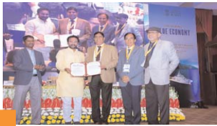
यह नीलामी और एक्सप्लोरेशन भारत की ब्लू इकोनॉमी को अनलॉक करेगा : जी. किशन रेड्डी, केंद्रीय मंत्री

केंद्रीय मंत्री जी. किशन रेड्डी ने नीलामी की शुरुआत की सराहना करते हुए इस कदम को अपतटीय