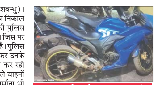
लापरवाही पूर्वक वाहन चलाने वाले हो जाए सावधान

का एक वर्ष पूर्ण होने जा रहा है। जहां तक भाटापारा नगर पालिका का सवाल है अब तक लगभग 12 करोड़ रुपए विकास राशि की स्वीकृति प्राप्त हो चुकी है। क्षेत्र में बड़ी संख्या में प्रधानमंत्री आवास योजना का लाभ मिल रहा है। जनहित को सभी योजनाओं के क्रियान्वयन में तेजी आई है। नगर की सफाई व्यवस्था से लेकर पेयजल व्यवस्था तक, निर्माण की गुणवत्ता से लेकर प्रकाश व्यवस्था तक, नक्शे पास करने से लेकर प्रधानमंत्री आवास योजना के क्रियान्वयन तक और केंद्र एवं राज्य सरकार की जनकल्याणकारी योजनाओं के क्रियान्वयन से लेकर विकास का रोड मैप तैयार करने तक कांग्रेस शासित नगर पालिका को पूर्ण रूप से फेल हो चुकी है। भाटापारा क्षेत्र की जनता ऐसी अकर्मन्त्य और निष्क्रिय व्यवस्था को उखाड़ फेंकने के लिए पूर्ण रूप से तैयार है।