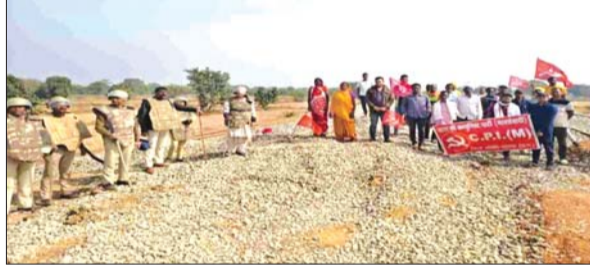
कोरबा, 29 नवंबर (देशबन्धु)। रेल विस्तार से खराब हुई सड़क को लेकर मड़वाढोढा के पास ग्रामीणों ने माकपा के नेतृत्व में काम को रोक दिया है। बड़ी संख्या में ग्रामीण काम रुकवाने पहुंचे हैं। ग्रामीणों का कहना है कि रेल विस्तार के कारण सड़क खराब हो गई है। इसके चलते बरसात में सड़क बंद हो जाएगी।

कोरबा, 29 नवंबर (देशबन्धु)। रेल विस्तार से खराब हुई सड़क को लेकर मड़वाढोढा के पास ग्रामीणों ने माकपा के नेतृत्व में काम को रोक दिया है। बड़ी संख्या में ग्रामीण काम रुकवाने पहुंचे हैं। ग्रामीणों का कहना है कि रेल विस्तार के कारण सड़क खराब हो गई है। इसके चलते बरसात में सड़क बंद हो जाएगी। ग्रामीणों के मुताबिक, गेवरा पेंड्रा रेल विस्तार के लिए मड़वाढोढा एवं पुरैना गांव को जोड़ने वाले मुख्य मार्ग को जर्जर कर दिया गया है। बरसात में सड़क मार्ग पूर्ण रूप से बंद हो जाएगा। खराब सड़क को लेकर मड़वाढोढा और पुरैना गांव के ग्रामीणों ने माकपा के नेतृत्व में विरोध प्रदर्शन करते हुए रेल विस्तार के काम को बंद कर दिया है। ग्रामीणों ने कहा कि जब तक मड़वाढोढा एवं पुरैना गांव को जोड़ने वाले मुख्य मार्ग को ठीक नहीं किया जाएगा तब तक रेल विस्तार के कार्य को शुरू नहीं होने देंगे। ग्रामीणों के विरोध के बाद गांव में बड़ी संख्या में पुलिस बल तैनात किया गया है।