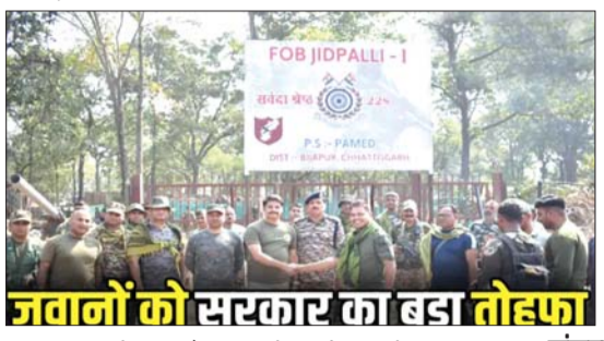
जवानों को सरकार का बड़ा तोहफा

का कुनवा भी कम हुआ है। 25-25 लाख के इनामी थे नक्सली इस साल मारे गए 207 नक्सलियों में से 5 ऐसे थे, जिन पर सरकार ने 25-25 लाख रुपए का इनाम रखा था। इसके अलावा नक्सलियों की मिलेटी फार्मेशन के कमांडर सहित 77 कॉर्डर वाले नक्सलियों को भी जवानों ने मार गिराया। नक्सलियों की पीपुल्स लिबरेशन गुरिल्ला आर्मी की ओर से जारी किए गए लिखित बयान में भी संगठन को हूए नुकसान का जिक्र है। संगठनात्मक ढांचे पर पड़ेगा गहरा असर बड़े नेताओं के मारे जाने से नक्सलियों की कमान और संगठनात्मक ढांचे पर गहरा प्रभाव पड़ेगा। जिससे उनका नेटवर्क कमजोर होगा। ये रणनीति न केवल नक्सलवाद को खत्म करने की दिशा में एक बड़ा कदम है, इतना ही नहीं इससे नक्सल प्रभावित क्षेत्रों में सुरक्षा और शांति की बहाली भी सुनिश्चित होगी।