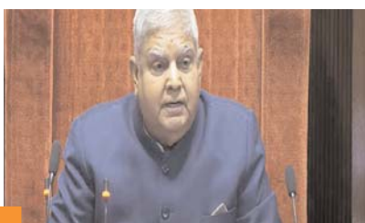
हम इस देश के लोगों का अपमान कर रहे हैं व उनकी उम्मीदों पर खरे नहीं उतर रहे हैं : जगदीप धनखड़

विशेष रूप से प्रश्नकाल का नहीं होना आम जनता को बहुत बड़ा झटका है। उन्होंने कहा कि नियम 267 को व्यवधान और सामान्य कामकाज से विचलित करने के एक उपकरण के रूप में हथियार बनाया जा रहा है। यह स्वीकार्य नहीं है। सभापति ने गहरी पीड़ा और अत्यंत दुःख व्यक्त करते हुए कहा कि हम एक बहुत ही बुरा उदाहरण पेश कर रहे हैं। हम इस देश के लोगों का अपमान कर रहे हैं। हम उनकी उम्मीदों पर खरे नहीं उतर रहे हैं। हमारे कार्य जन-केंद्रित नहीं हैं। हम