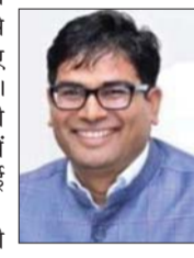
वित्त मंत्री ओपी चौधरी ने अपने आधिकारिक एक्स अकाउंट पर एक पोस्ट शेयर की है, जिसमें उन्होंने लिखा- प्रिय युवा साथियों, छत्तीसगढ़ राज्य लोक सेवा आयोग की राज्य सेवा परीक्षा-2023 के सफल अभ्यर्थियों को हार्दिक बधाई एवं शुभकामनाएं। कठिन परिश्रम व दृढ़ निश्चय ने आपको इस मुकाम तक पहुंचाया है। यह सफलता आपके व्यक्तित्व प्रयासों के साथ परिवार, शिक्षकों व समर्पित मार्गदर्शकों का फल है।

रायपुर, 29 नवंबर (देशबन्धु)। छत्तीसगढ़ लोक सेवा आयोग (पीएससी) ने राज्य सेवा परीक्षा-2023 का परिणाम घोषित कर दिया है। इस बार कुल 703 अभ्यर्थियों ने साक्षात्कार के लिए अपनी जगह बनाई थी, जिनमें से 243 पदों पर भर्ती के लिए चयन किया गया है। छत्तीसगढ़ के वित्त मंत्री ओपी चौधरी ने परीक्षा में सफल अभ्यर्थियों को बधाई और शुभकामनाएं दी हैं। वित्त मंत्री ओपी चौधरी ने अपने आधिकारिक एक्स अकाउंट पर एक पोस्ट शेयर की है, जिसमें उन्होंने लिखा- प्रिय युवा साथियों, छत्तीसगढ़ राज्य लोक सेवा आयोग की राज्य सेवा परीक्षा-2023 के सफल अभ्यर्थियों को हार्दिक बधाई एवं शुभकामनाएं। कठिन परिश्रम व दृढ़ निश्चय ने आपको इस मुकाम तक पहुंचाया है। यह सफलता आपके व्यक्तित्व प्रयासों के साथ परिवार, शिक्षकों व समर्पित मार्गदर्शकों का फल है। वित्त मंत्री ओपी चौधरी ने आगे कहा कि यह केवल आपके लिए एक