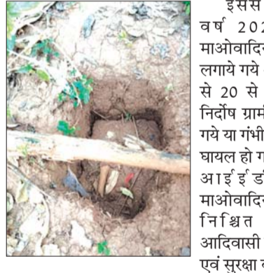
सुरक्षा बलों ने नारायणपुर-कुतुल मुख्य मार्ग पर 5 किलो से अधिक वजन वाले 3 आईईडी को खोजकर सुरक्षात्मक मानकों का पालन करते हुए एक बरामद तीनों आई.ई.डी. को निष्क्रिय किया गया,

नारायणपुर, 29 नवम्बर (देशबन्धु)। वरिष्ठ अधिकारियों के निर्देशन में नारायणपुर पुलिस के द्वारा लगातार क्षेत्र में सघन नक्सल विरोधी "माडू बचाव" अभियान संचालित किया जा रहा है। इसी कड़ी में नारायणपुर से डीआरजी एवं बीडीएस के संयुक्त बल नक्सल विरोधी अभियान पर माडू क्षेत्र की ओर रवाना हुए थे। सुरक्षा बलों ने नारायणपुर-कुतुल मुख्य मार्ग पर 5 किलो से अधिक वजन वाले 3 आईईडी को खोजकर सुरक्षात्मक मानकों का पालन करते हुए एक बरामद तीनों आई.ई.डी. को निष्क्रिय किया गया, जिससे स्थानीय आदिवासी ग्रामीणों की मौत हो सकती थी या वे गंभीर रूप से घायल हो सकते थे। इससे पहले वर्ष 2024 में माओवादियों द्वारा लगाये गये आईईडी से 20 से अधिक निर्दोष ग्रामीण मारे गये या गंभीर रूप से घायल हो गये। एक आईईडी को माओवादियों द्वारा निश्चित ही आदिवासी ग्रामीणों एवं सुरक्षा बलों को खतरा हुआ है। नक्सलाने पहचाने के नीयत से लगाया गया था। सुरक्षा बलों की सजगता और सतर्कता से आईईडी को बरामद कर निष्क्रिय किया गया। उक्त कार्यवाही में डीआरजी एवं बीडीएस टीम की विशेष भूमिका रही है।