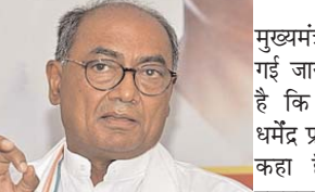
राशि की कमी से अभियान के प्रभावित होने का बताया खतरा

भोपाल, 29 नवम्बर (एजेंसियां)। मध्य प्रदेश के पूर्व मुख्यमंत्री और राज्यसभा सांसद दिग्विजय सिंह ने केंद्रीय शिक्षा मंत्री धर्मेंद्र प्रधान को पत्र लिखकर समग्र शिक्षा अभियान (एसएसए) के तहत राज्यों को आर्बिट्रिट की जाने वाली धनराशि जारी करने में हो रही देरी का मुद्दा उठाया। राशि की कमी से अभियान के प्रभावित होने का खतरा भी बताया है।