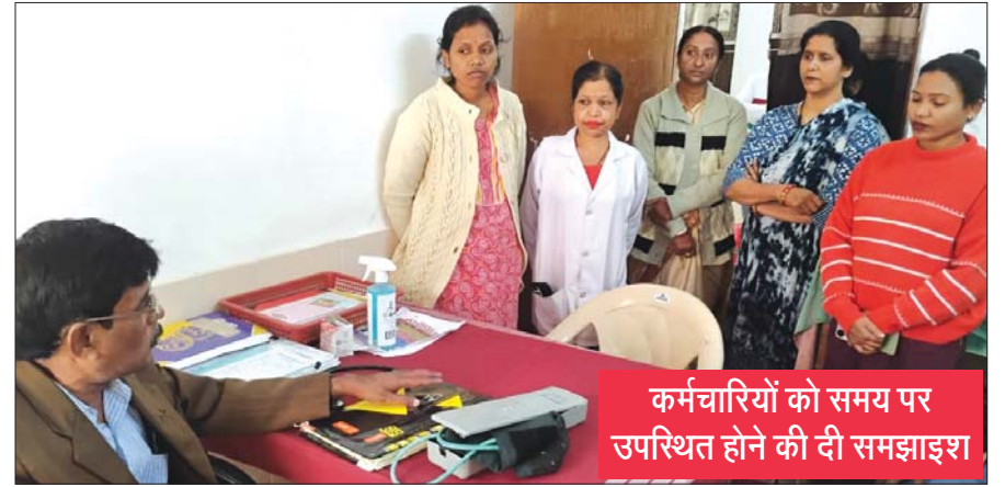
कर्मचारियों को समय पर उपस्थित होने की दी समझाइश

जगदलपुर, 29 नवंबर (देशबन्धु)। सीएमएचओ डॉ. संजय बसाक द्वारा बस्तर जिले के स्वास्थ्य केंद्रों की व्यवस्था सुधारने को लेकर निरंतर प्रयास किया जा रहा है। इसी क्रम में डॉक्टर संजय बसाक द्वारा शुक्रवार को सीएचसी नानगुर का औचक निरीक्षण किया गया। इसके अंतर्गत आने वाले सीएचसी नानगुर, पीएचसी कुरंदी, और एसएचसी