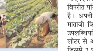
180 गांवों के 30 हजार से ज्यादा किसान परिवार हो रहे लाभान्वित

नई दिल्ली, 29 नवम्बर (एजेंसियां)। जस्ता, सीसा, चांदी और कैडमियम का एकीकृत खनन और संसाधन उत्पादक कंपनी हिंदुस्तान जिंक की समाधान पहल के तहत घाटावाला माताजी किसान उत्पादक कंपनी राजस्थान में ग्रामीण डेयरी क्षेत्र में सकारात्मक बदलाव ला रही है। कंपनी ने शुक्रवार को बयान जारी कर बताया कि उदयपुर के बिछड़ी गांव में वर्ष 2022 में स्थापित, महिलाओं के नेतृत्व वाला यह उद्यम बाजार तक पहुंच, उचित मूल्य और स्थायी आय सुनिश्चित कर डेयरी किसानों के लिए जीवन रेखा बना है। गौयम ब्रांड के तहत, जीएमएफपीओ उच्च गुणवत्ता का ताजा दूध और प्रीमियम डेयरी उत्पाद उपलब्ध करा रहा है, जो ग्रामीण समुदायों के जीवन में सफलता और सकारात्मक बदलाव का उदाहरण है। देवारी क्षेत्र के आस पास के गांवों के लगभग एक हजार शेरधारकों द्वारा संचालित, जीएमएफपीओ सामूहिक उद्यम की शक्ति इसका सशक्त प्रमाण है। यह पहल हिंदुस्तान जिंक के समाधान कार्यक्रम के तहत संचालित हो रही है। घाटावाला माताजी एफपीओ से जुड़ी