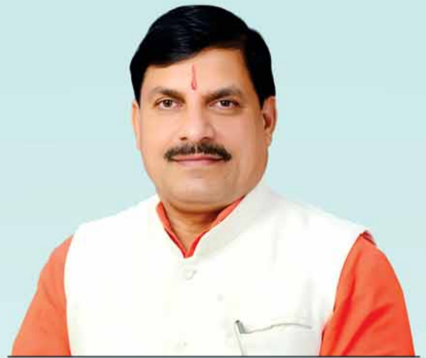
डॉ. मोहन यादव, मुख्यमंत्री

21 नवम्बर, 2024 | अपराह्न 2:00 बजे सामाजिक न्याय परिसर उज्जैन, मध्यप्रदेश