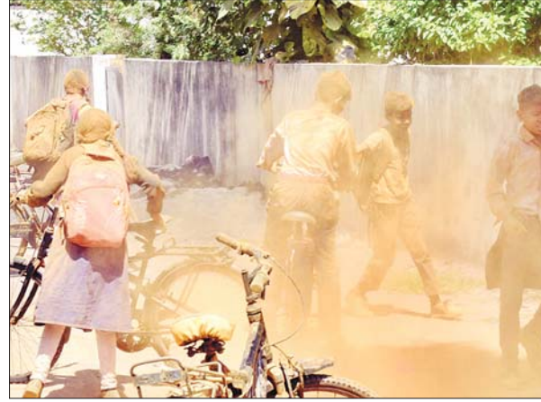
स्कूली बच्चों ने रंग गुलाल खेलने का काम किया।