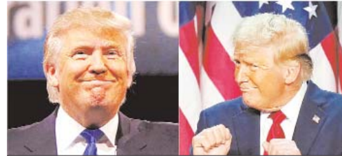
दुनिया पर छाए मंदी के बादल

नई दिल्ली। राष्ट्रपति चुनाव जीतने के बाद ट्रंप ने जो ट्रेड वॉर छोड़े और टैरिफ बढ़ाने का ऐलान किया, उसे उन्होंने अब लागू करना शुरू कर दिया है। आपको बता दें कि राष्ट्रपति डोनाल्ड ट्रंप ने बुधवार को आधिकारिक तौर पर सभी इस्पात और एल्युमीनियम आयात पर शुल्क बढ़ाकर 25 प्रतिशत कर दिया।