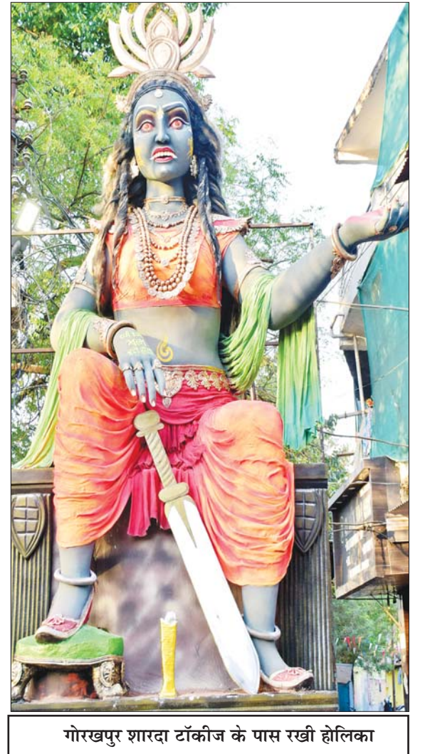
गोरखपुर शारदा टॉकीज के पास रखी होलिका