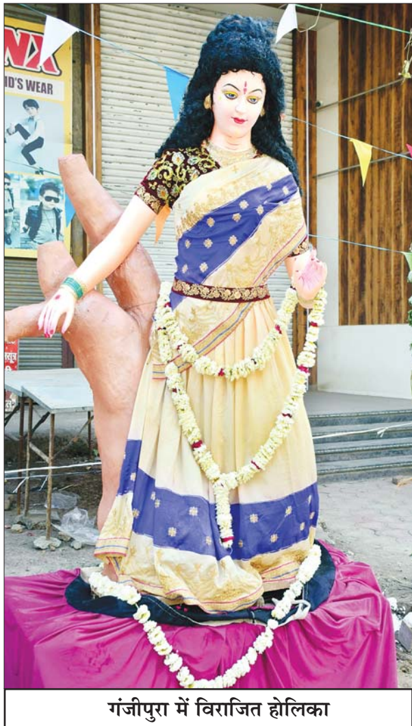
गंजीपुरा में विराजित होलिका