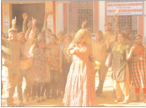
नगर में होली पर्व मनाने का क्रम शुरू हो गया है।