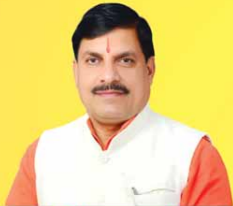
डॉ. मोहन यादव, मुख्यमंत्री