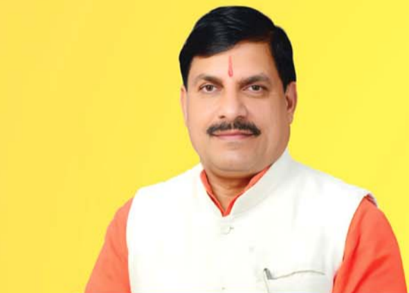
डॉ. मोहन यादव, मुख्यमंत्री