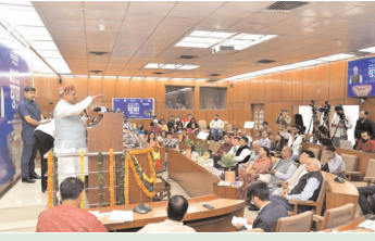
युवा संसद में दिल्ली के विभिन्न जिलों से चयनित 30 प्रतिभागियों ने लिया भाग

नई दिल्ली, 31 मार्च (देशबन्धु)। दिल्ली विधानसभा और नेहरू युवा केंद्र संगठन के संयुक्त तत्वावधान में सोमवार, 31 मार्च को राज्य स्तरीय 'विकसित भारत