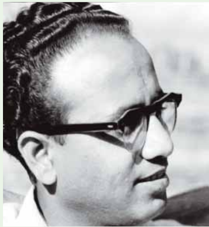
बयार आई ज़रूर है, लेकिन उसकी गति अभी भी कुछ धीमी है।

से जुड़े ऐसे कई सवाल हैं, जिन्हें शानी ने प्रमुखता से उठाया है। भारतीय समाज में महिलाओं के साथ जो गैर-बराबरी का माहौल है। लैंगिक असमानता, अत्याचार, उत्पीड़न और उनके शोषण के कई किस्से ‘काला जल’ में महिला किरदारों के जरिए आये हैं। हिंदू समाज हो या फिर मुस्लिम दोनों ही समाज, पितृसत्तात्मक समाज रहे हैं। जिसमें महिलाओं के अधिकारों की कभी कोई परवाह नहीं की गई। महिलाओं के भी कुछ जज़्बात होते हैं, उनको हमेशा नज़रअंदाज़ किया गया। इस हद तक कि वे ईसान हैं, यह मानने से भी इंकार किया गया। उनकी खूबियों और अरमान को कोई तवज़ोह नहीं दी गई। आलम यह है कि पैदा होते ही स्त्रियों के जीवन में कई बर्दशों और उनके पैरों में बेहियाँ पड़ जाती हैं। जिन्हें तोड़ने में ही उनकी पूरी ज़िंदगी गुज़र जाती है। ‘काला जल’ में एक नहीं कई ऐसे महिला किरदार हैं, जिनके मार्फ़त शानी महिलाओं की बात करते हैं। हालाँकि, ज़्यादातर महिला किरदार मुस्लिम हैं। मिसाल के तौर पर छोटी फूफ़ी, मुमानी उर्फ़ बब्बन की अम्मी, बी-दारोगिन, बिलासपुरवाली, सल्लो, मालती, रशीदा और रूबीना। लेकिन यदि नाम भर बदल दिये जाएँ, मसलन रमा, श्यामा, सीता, सावित्री तो उनकी कहानी भी वही होगी, जो मुस्लिम महिलाओं की है। भारतीय समाज में किसी भी धर्म, समुदाय की महिलाएँ हों, उनका अपने समाज में दायम दर्जा ही रहा है। इक्कीसवीं सदी में बदलाव की