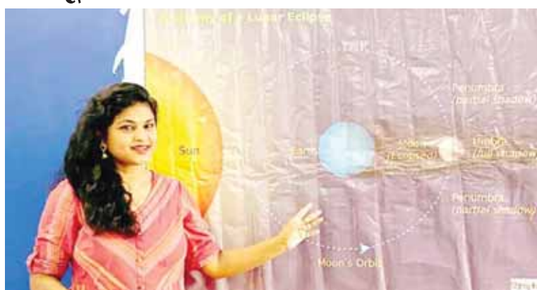
में पड़ने वाला अगला चंद्रग्रहण भी 1 घंटे 24 मिनट 54 सेकेंड की टोटेलिटी का होगा। इसलिये यह एक ही कैलेंडर साल में पड़ने वाला मोस्ट बेलेन्ड पेपर ऑफ टोटल लुनार इकलिप्स है। यह सन् 1661 के बाद होने वाली घटना है जो कि अब आगे 2091 में होगी।