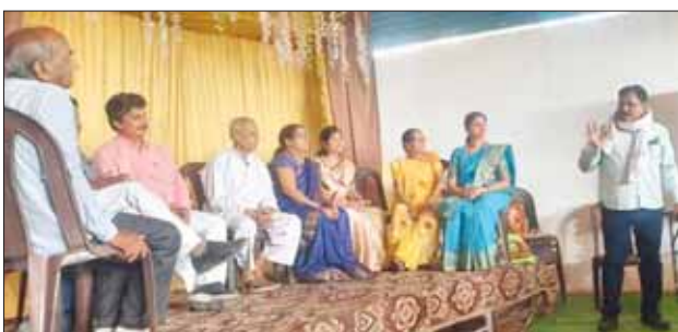
बैठक में इटारसी, होशंगाबाद, भोपाल, पिपरिया, टिम्बरन, हरदा सहित अन्य स्थानों के स्थानीय संगठन अध्यक्ष सहित बड़ी संख्या में सामाजिक सदस्य