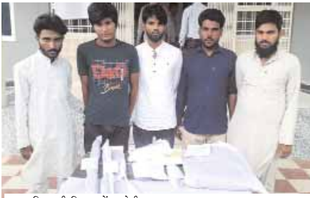
पुलिस की गिरफ्तार में आरोपी